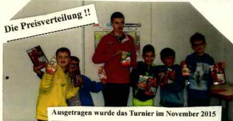
Ausgetragen wurde das Turnier im November 2015

Haus der Vereine, Offenbacher Straße 35, 63263 Neu-Isenburg. Spielabend ist dienstags.